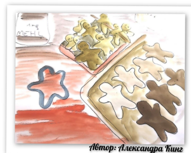
Автор: Александра Кинг 1 курс СВО группа 20-СВ-21