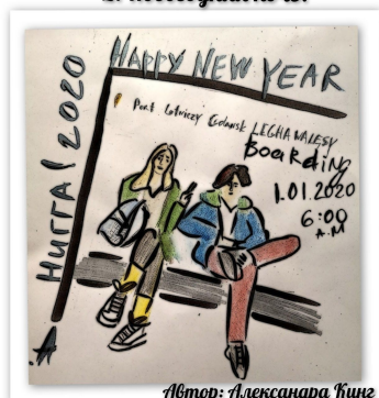
Автор: Александра Кинг 1 курс СВО группа 20-СВ-21

1 января по традиции сразу после пересечения польской границы мы вскрываем сладкие подарки, приготовленные дедом морозом нам в дорогу. А основные подарки, всё по той же семейной традиции, мы выбираем себе сами. Немецкий Дед мороз - Вайнахтсман (Weihnachtsmann) оставляет нам под подушкой конвертики с евро. Этой суммы всегда хватает на серьезные покупки: мобильный телефон, гитару, ну или просто в копилку.